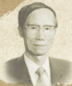
The BK Min's Memorial Lecture